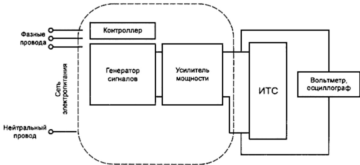
Рисунок 3 - Схема испытательного оборудования с усилителем мощности